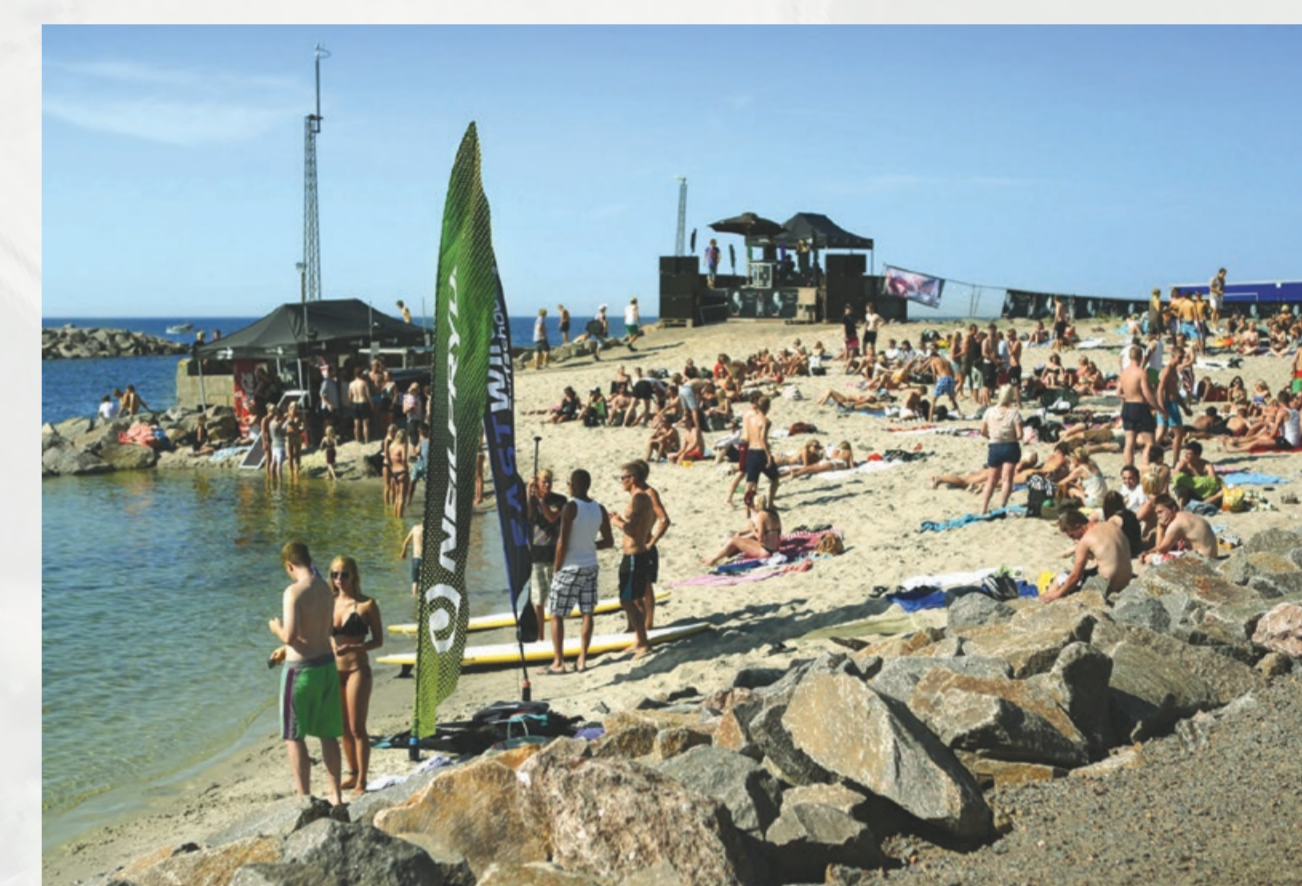
På Vang Pier kan du bl.a. bade, lystfiske og fra dækmolen opleve den fantastiske klippekyst.

The bridge connecting the coastal path over the ravine was designed by artist Peter Bonnén in 2001–2002.