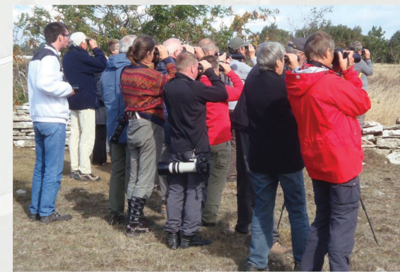
Fra tidligt forår til midt i juli er fuglenes ynglesæson. Vær opmærksom på hvor der er reder og unger og træk væk, hvis fuglene viser tegn på uro.

In the area around the "Nevada" cliff, climbing routes have been bolted onto the rock face, and rock climbing is permitted in much of the area.