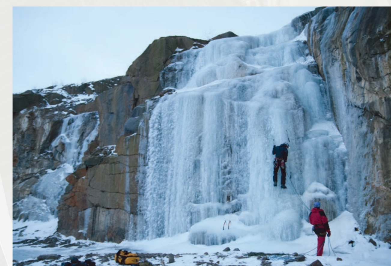
I området omkring Nevadaklippen er boltet klatreruter, og i store dele af området er klatring tilladt.

Walking and cycling in the area are permitted on paths and roads in the bottom of the former quarry.