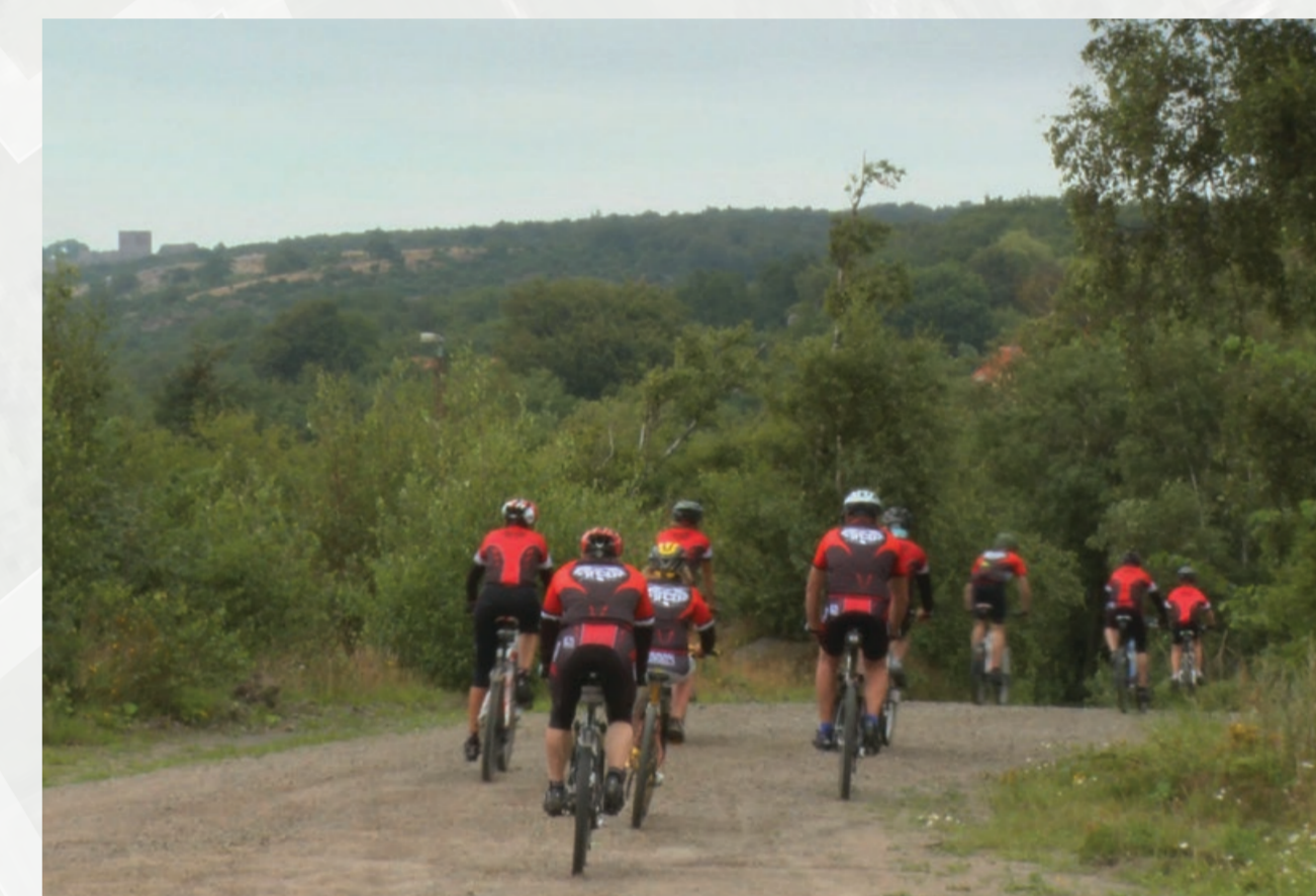
Færdsel til fods eller på cykel er tilladt på stier og veje og i bunden af de tidligere brud.

It is possible to bathe, angle, experience the magnificent rocky coastline, etc., from Vang Pier.