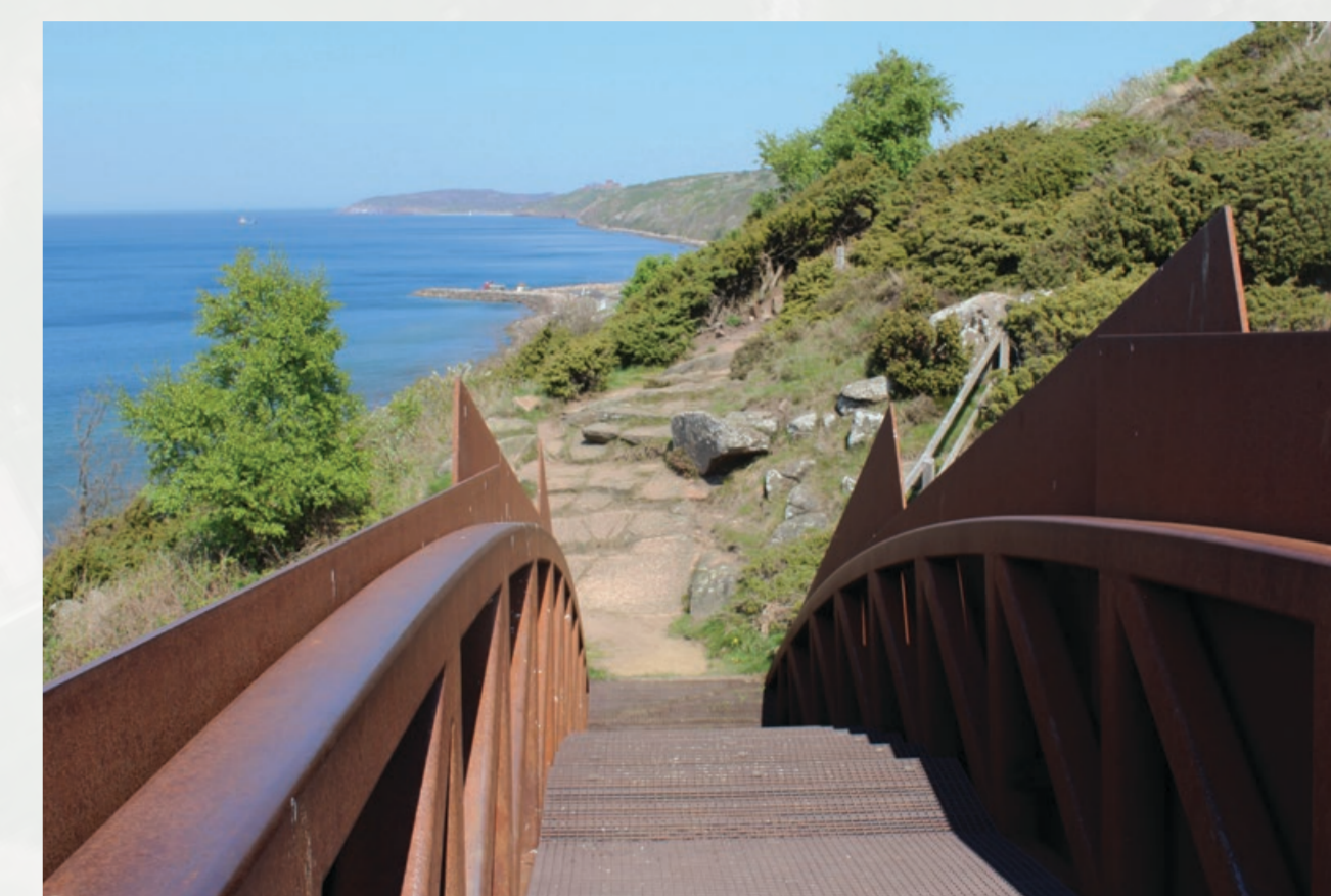
Broen der forbinder kyststien over kløften er skabt af kunstneren Peter Bonnén i 2001/2002.

The bridge connecting the coastal path over the ravine was designed by artist Peter Bonnén in 2001–2002.